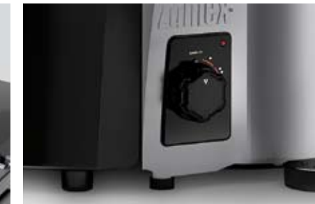
Système SILENT-BLOC. Anti-vibration.