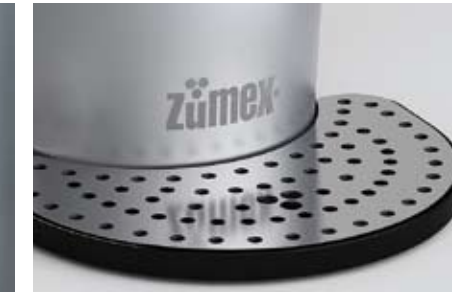
Bac égoutteur amovible.