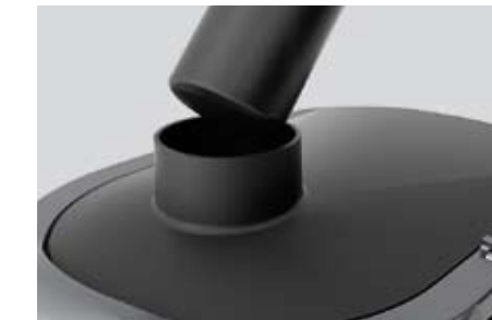
Orifice d'entrée large (75 mm).