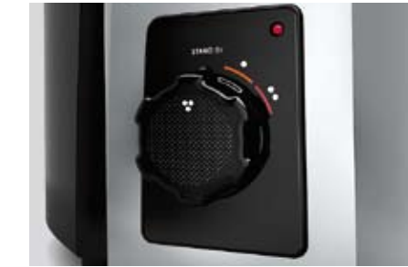
Sélecteur avec 2 positions : Fruit mou. Légume dur.

Pour la première fois est incorporé un interrupteur d'alimentation situé à l'arrière qui permet de disposer de l'état STAND BY et donc d'économiser de l'énergie. Son sélecteur intelligent, unique sur le marché, permet d'adapter la puissance de la machine au type de fruit et de légume.